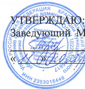
График сменности работников